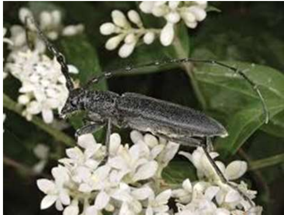
شکل ۷: جلب شدن حشره کامل به گل آذین سفید رنگ