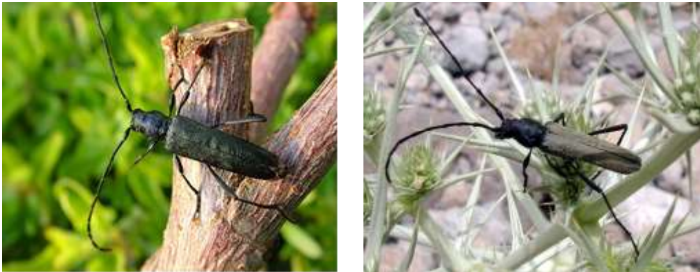
شکل ۶: حشره کامل آفت سوسک شاخک بلند

حشره کامل: سوسک بالغ ماده به رنگ سیاه، سوسک های نر به رنگ قهوه ای مات و بعضی از نمونه ها، رنگ بنفش کم رنگ دارند. حشره کامل به طول ۳/۵-۲/۵ سانتی متر دارای شاخک های بلندی است که از انتهای بدن می گذرد (شکل ۶).