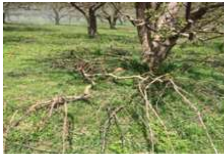
شکل ۸: هرس سرشاخه های آلوده به لارو آفت